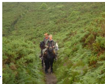
Landes de Liscuis

Ce mémorable week end, un peu gâché tout de même par la météo, s'est terminé en début d'après midi par un repas de clôture à la salle des fêtes, avant de prendre la route du retour en se promettant de se retrouver dès l'année prochaine.... pourquoi pas à « Fort Saint Père », près de DOL de BRETAGNE en Ille et Vilaine en Juin 2012 pour une nouvelle édition de la fête EQUIBREIZH !