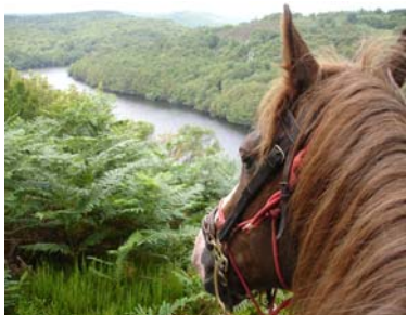
Lac de Guerlédan

Le dimanche, toujours sous la pluie, les cavaliers ont effectué une superbe balade dans les landes de Liscuis, à la découverte des allées couvertes préhistoriques, traversé le bois de Gouarec avec un retour par le long des berges du Canal de NANTES à BREST.